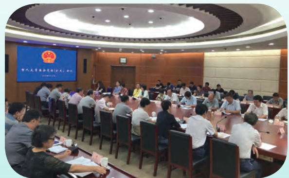
8月22日，市人大常委会党组书记、主任陈振一主持召开市人大常委会党组（扩大）会议，集体学习习近平总书记对地方人大及其常委会工作作出的重要指示精神和全国人大常委会委员长栗战书在纪念地方人大设立常委会40周年座谈会上的讲话。