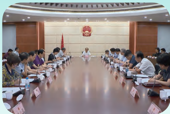
7月8日，市人大常委会主任陈振一主持召开市十六届人大常委会第30次主任会议。