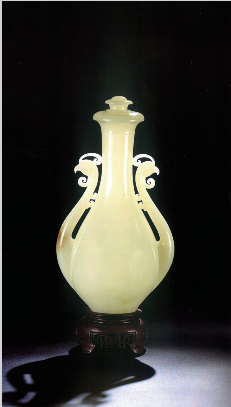
玉石雕刻：凤瓶 设计创作：唐建波