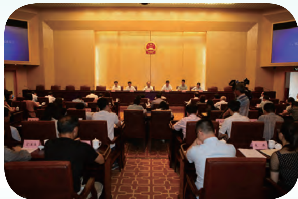
7月19日，全市人大宣传工作会议召开，市人大常委会主任陈振一出席会议并讲话。