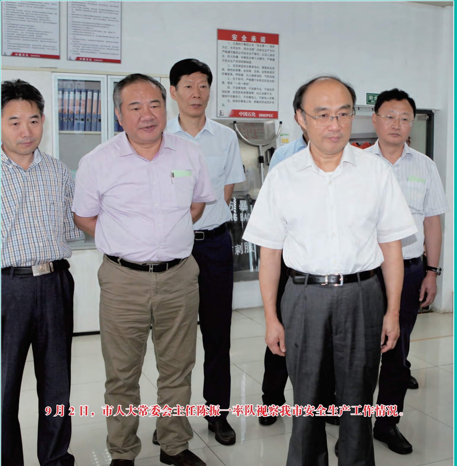
9月2日，市人大常委会主任陈振一率队视察我市安全生产工作情况。