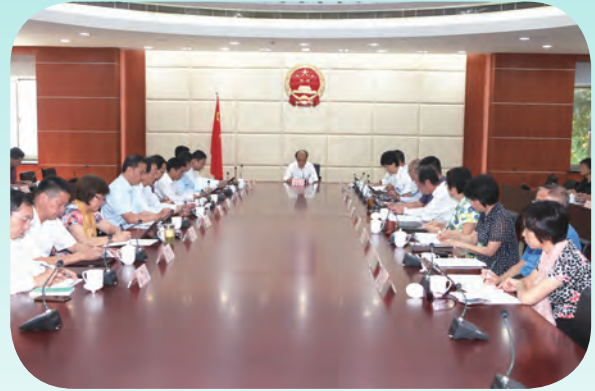
8月5日，市人大常委会主任陈振一主持召开市十六届人大常委会第31次主任会议。