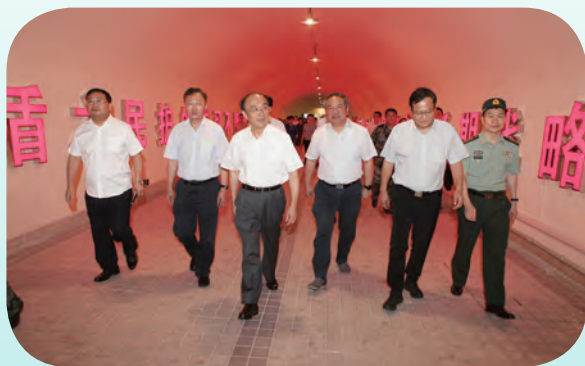
7月25日，市人大常委会主任陈振一率队对我市人民防空建设情况开展专题视察。